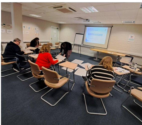
Lokalni sastanak radne skupine u Kellsu, Irska