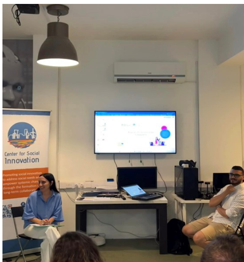
Radionica za roditelje na Cipru

Osim sastanaka partnerstva u zajednici, LHF je organizirao svoju prvu radionicu posebno prilagođenu roditeljima. Fokusirana na Prvo područje kompetencija unutar Modela kompetencija "Digital Upbringing", radionica je istraživala zanimljive teme poput tehnologije deepfake, "besplatnih" online aplikacija i suptilnosti algoritama društvenih medija. Roditelji su aktivno sudjelovali u stimulativnim raspravama, dijeljenju svojih iskustava i sudjelovanju u poticajnim razgovorima. Organizatori s oduševljenjem izvješćuju da je radionica premašila očekivanja, a sudionici su izrazili zadovoljstvo "razmjenom savjeta i iskustava" i zahvalnost za obilje "zanimljivih i korisnih saznanja".