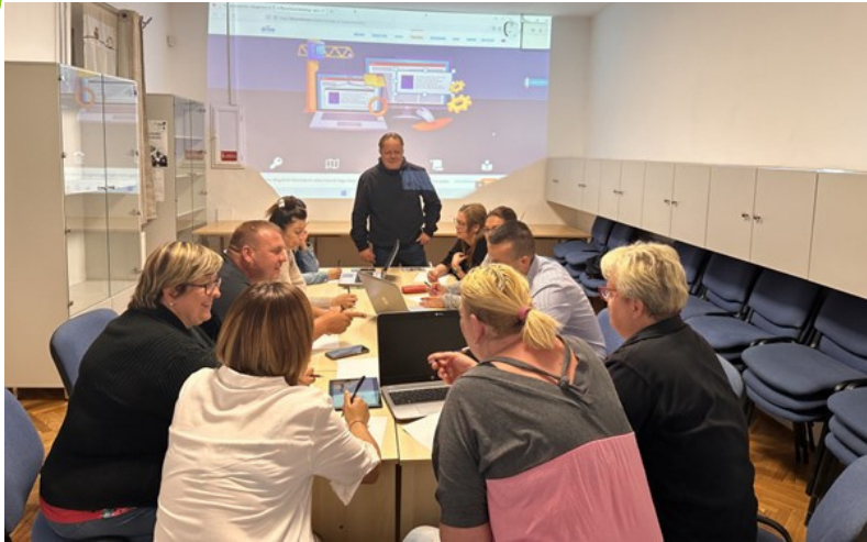
Radionica za roditelje u Mađarskoj