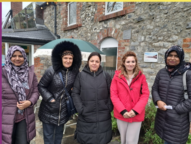
Sudionici fokus grupe koju je organizirao Meath Partnership u Irskoj

Meath Partnership proveo je svoje fokus grupe u Irskoj u subotu, 26. studenog 2022, u idiličnom okruženju Sonairte Eko-centra u Co. Meathu, gdje su sudionici uživali u opuštenom i mirnim okruženju u prirodi. Šestero roditelja, od kojih svačije dijete ima iskustva u korištenju online alata, sudjelovalo je u fokus grupi. Sudionici i njihova djeca različitog su godišta i nacionalnosti i svatko se suočava s različitim izazovima što se tiče digitalnih sposobnosti i korištenju online aplikacija, alata i resursa.