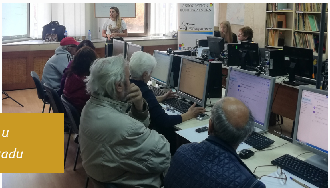
Radionice u Blagoevgradu