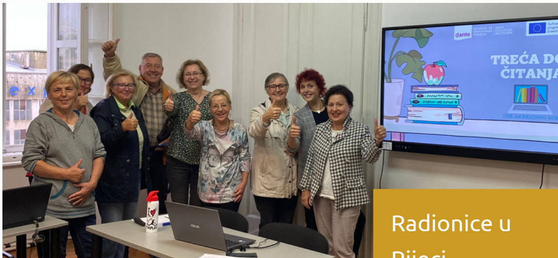
Radionice u Rijeci